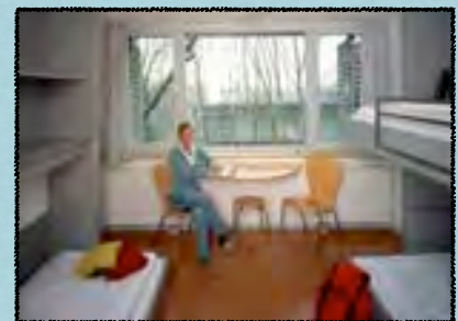
Zimmerbeispiel für drei Personen