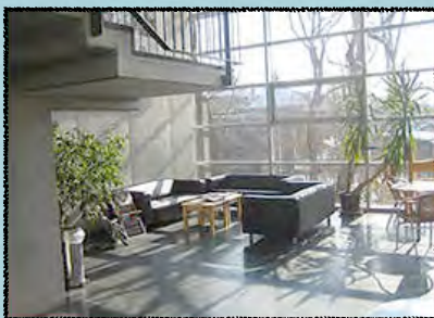
EINGANGSBEREICH DER BILDUNGSSTÄTTE