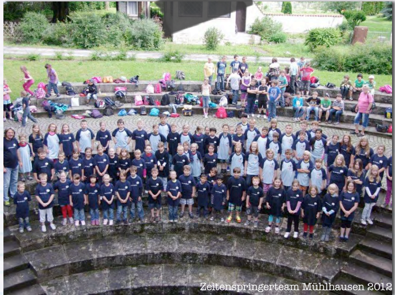
Zeiteinspringerteam Mühlhausen 2012